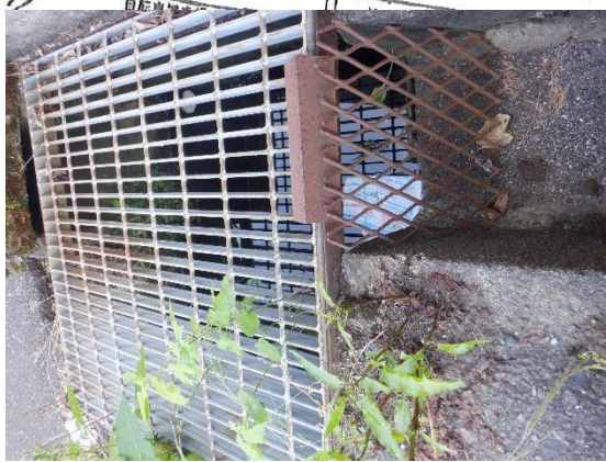
釜石・花巻間 市道神内町線