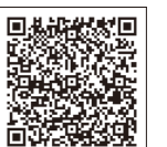
市のホームページ