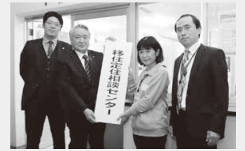
市役所第3庁舎1階に設置します

定住促進と産業振興を一体的に展開するため、総合政策課内にあった定住推進室を商工観光課内に移管し、移住定住相談センターを設置します。これまでの商工観光施策などで構築したネットワークを活用し、釜石の魅力効果を効果的に発信し、移住定住者の確保に向けた支援を推進します。