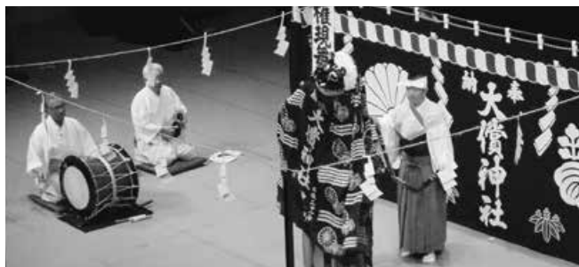
昨年のステージ発表 (大償神楽保存会「早池峰神楽」)