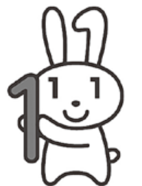
マイナンバーPRキャラクター マイナちゃん