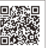
知って欲しい防災情報