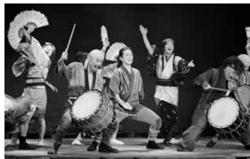
2019年ツアー公演より