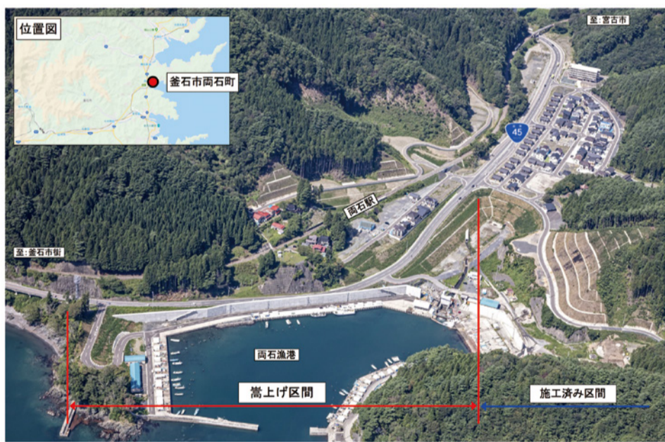
両石漁港海岸災害復旧事業 平面図