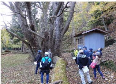
《砂子畑地区の明神かつら》

橋野町振興協議会が企画した鶉住居川流域巨木ツーリズムが11月8日、約20人が参加して行われました。