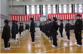
甲子中学校入学式