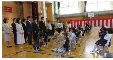
甲子小学校入学式