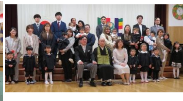
正福寺幼稚園入園式