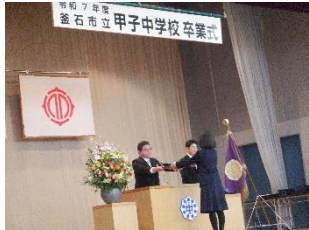
甲子中学校卒業式