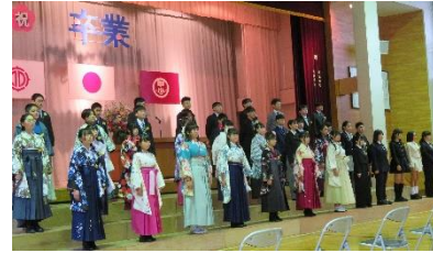
甲子小学校卒業式

◇119番通報の受信場所が変わります これまで「119番通報」は釜石大槌消防本部で受付けていましたが、 4月1日から「いわて消防センター」(盛岡消防本部内)で受付となります。 県内各地から通報が寄せられますので、119番通報の際は、 「釜石市〇〇町」と市名を含めた住所を伝えて下さい。 問合先：釜石大槌地区行政事務組合 消防本部消防課 ☎22-1642