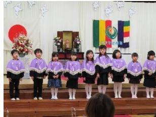
正福寺幼稚園卒園式