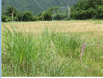
草刈前グラウンド

旧大松小学校グラウンドと体育館は、甲子地域会議と釜石市との間で利用に伴い、管理及び環境整備業務に係る覚書を締結しています。7月4日(金) 午前8時から旧大松小学校グラウンドの草刈り作業を行いました。地域会議構成員の各町内会・自治会、高齢者卓球教室から31名が参加しました。