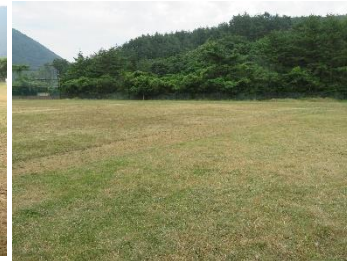
草刈後グラウンド