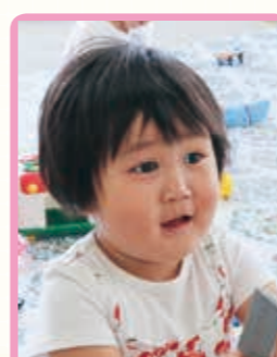
うしおみ ねほ 丑淵滯穂ちゃん(2歳) 活発でめんどろの良なお姉ちゃん! これからも元気に大きくなってね!