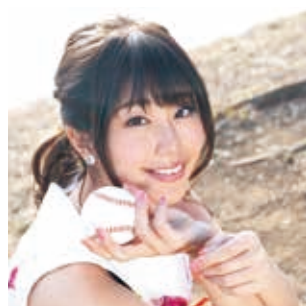
稲村 亜美 さん