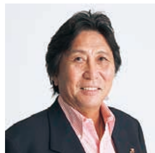
松尾 雄治 さん