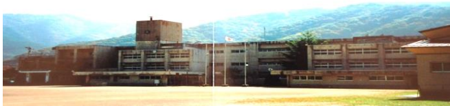
【旧中妻小学校 校舎】

『『双』の頭文字をモチーフに、その中に小学校の『小』を配し、緑豊かな自然に恵まれた環境にある釜石地域の学舎で、明るく元気に次世代を生きる子どもたちが、芸術・スポーツ・文化と生き生き共生し、未来に向かって羽ばたき、若葉のように逞しく成長する姿を表している。』の意図でデザインされた井口やすひさ氏（東京都）の作品であり、一般公募によるものである。