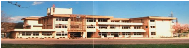
【旧八雲小学校 校舎】

旧八雲小、旧中妻小の両校を双葉にイメージし、「双葉から本葉になり、地域に根を張り未来に向かってまっすぐ伸びる大きな樹は、個性豊かな実り（子どもたち）を育む」という願いが込められた一般公募による校名である。「新しい学校が、地域や子どもたちの融和の象徴となるように、二つの学校の歴史と伝統を引き継ぎ、地域コミュニティの中核として、未来に向けて発展していくように」という願いのもと決定されたものである。