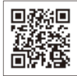
チケットID登録サイト