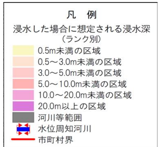
【甲子川洪水浸水想定区域図（想定最大規模）】