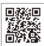
チケットID登録サイト

ピンバッジの配付終了しました 各地区生活応援センターなどで配布していたラグビーワールドカップ2019™のホストシティマークをかたどったピンバッジは、好評につき無くなりましたので配布を終了しました。