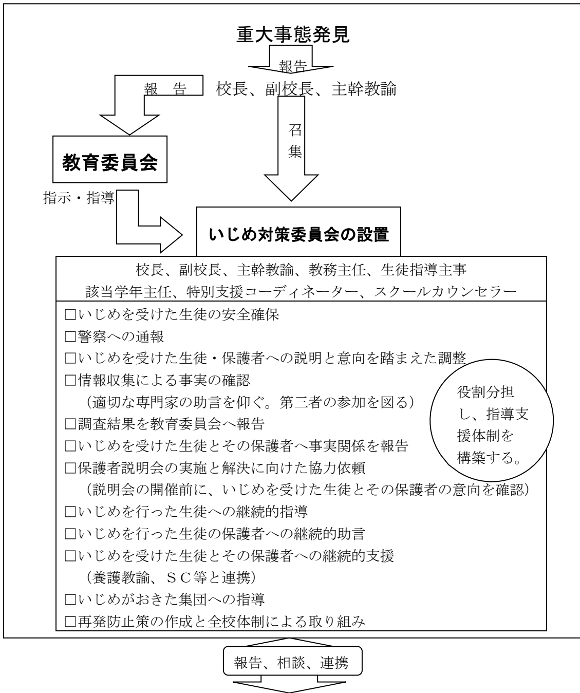
図3 いじめ防止体制（重大事態発生時）