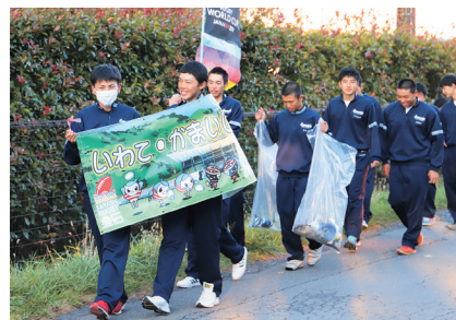
横断幕でPRしながら清掃活動をする釜石高生