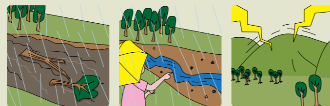
急に川の流が濁り、流木が混ざっている 雨が降り続けているのに、川の水位が下がる 山鳴りがする