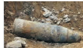
発見された不発弾