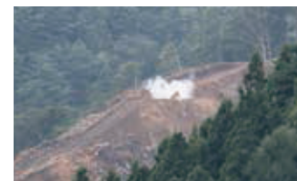
8月30日に爆破処分しました

不発弾を爆破処分しました 6月27日に唐丹町大曾根で発見された不発弾は、発見から約2カ月後の8月30日11時30分、現地で陸上自衛隊が爆破処分しました。 発見後、6月28日には、自衛隊、警察、消防などと釜石市不発弾処理合同対策本部を設置し対応に当たり、7月9日からは、不発弾を土のうなどで覆い被せる覆土処理を行ってきました。 今回の不発弾は全長約145cm、直径約45cmで、昭和20年の艦砲射撃で放たれた米軍の16インチ艦砲弾です。移動には危険が伴うため、現地での爆破処分となりました。不発弾の爆破処分は、平成17年の両石町(女遊部)での処分以来となります。 市内には今も手つかずの不発弾が地下に埋まっている可能性があります。不発弾は何らかの理由で爆発せずに残っているもので、衝撃を与えると爆発の危険があります。発見した場合は、すぐに市防災危機管理課へお知らせください。