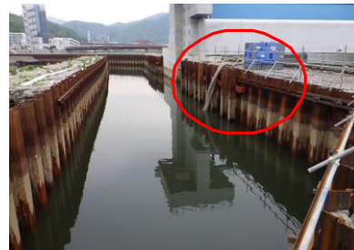
仮締切内排水の様子