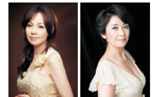
ソプラノ 森 麻季