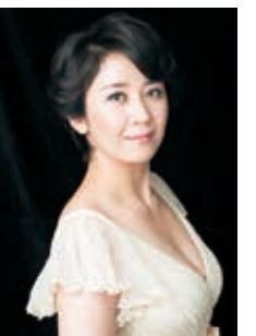
メゾ・ソプラノ 林美智子