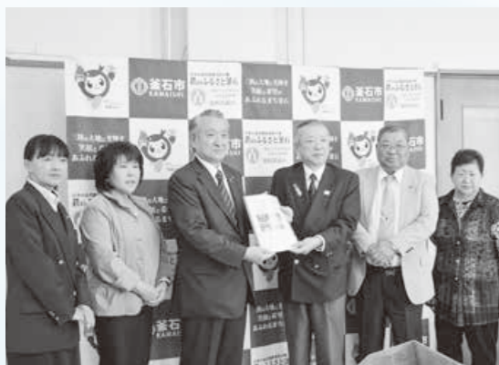
6月22日に防災市民憲章の草案が市長に提言されました(市長と市民会議の代表幹事ら)