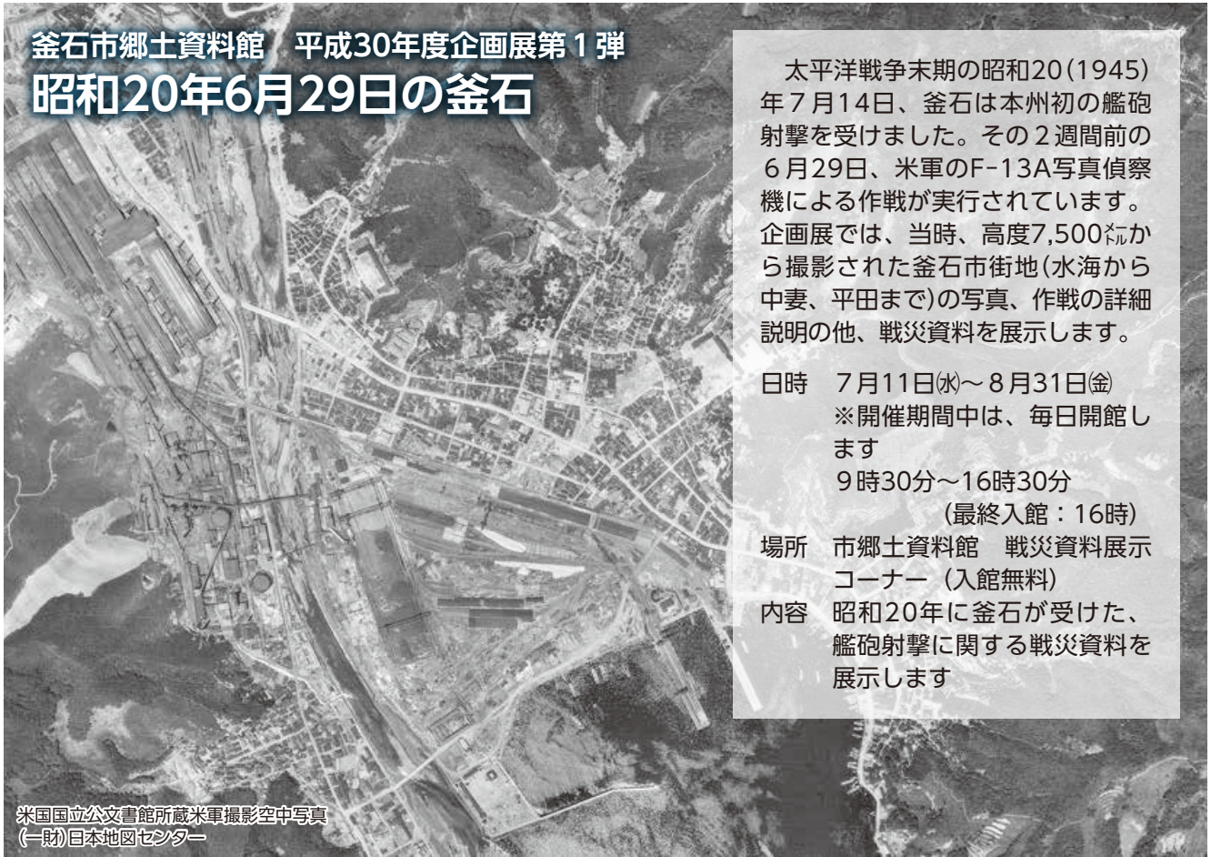
米国立公文書館所蔵米軍撮影空中写真 (一財)日本地図センター

太平洋戦争末期の昭和20(1945)年7月14日、釜石は本州初の艦砲射撃を受けました。その2週間前の6月29日、米軍のF-13A写真偵察機による作戦が実行されています。企画展では、当時、高度7,500 フィート から撮影された釜石市街地(水海から中妻、平田まで)の写真、作戦の詳細説明の他、戦災資料を展示します。