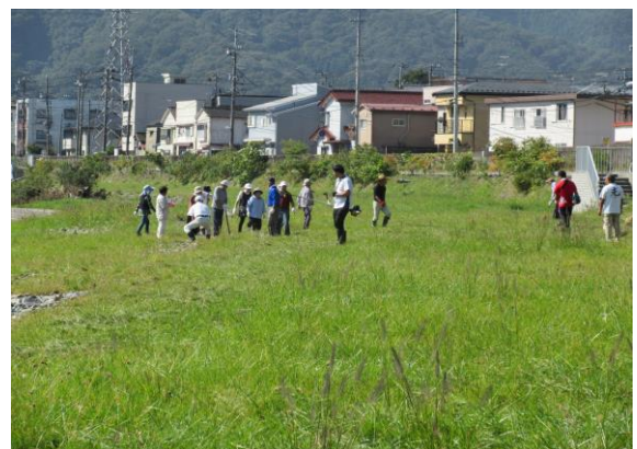
事前の草刈り風景

各利用者の方々に協力して、皆さんが気持ちよく使えるように、環境美化等に努めましょう。