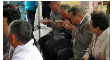
(上)フルート演奏者4名 (下)地区住民代表者の皆様