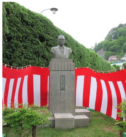
移設された三鬼隆像