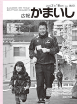
広報かまいし2015年2月18日号の表紙