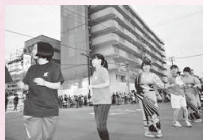
「ハァー スタコラサッサ 地震だ強いぞ津波が来るぞ ハァ スタコラサッサ」