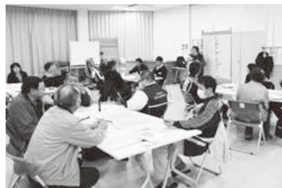
グループで考えた言葉の発表 (鵜住居地区)