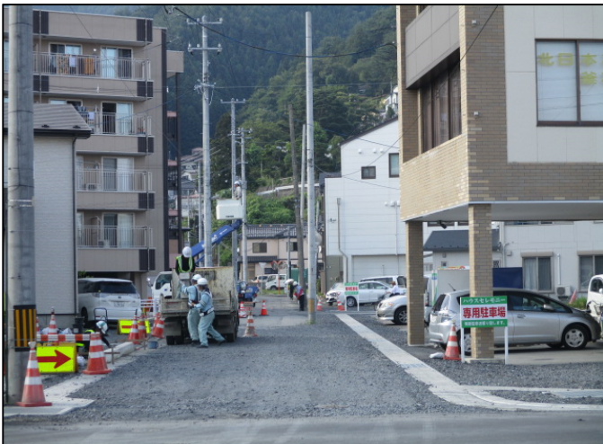
只越町1丁目1番付近の道路工事→ 下水道管敷設のため、片側通行して いただいています。