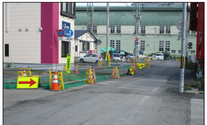
← 只越2号復興公営住宅付近の道路工事 仮電柱が撤去されずに道路が狭く、舗装前 の状態です。片側通行していただいています。