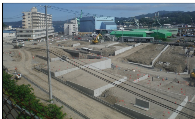
⑧-1-1ブロック（只越町2丁目、3丁目）の宅地造成工事 8月から引渡し予定です。