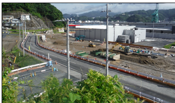
⑫～⑬ブロック（浜町2、3丁目、東前町）の仮設道路 東前町から浜町に向かって嵩上げ工事を行います。