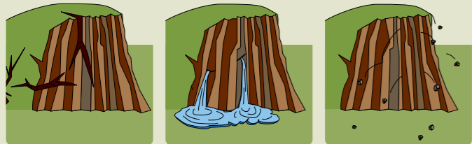
がけに割れ目が見える がけから水が湧き出ている がけから小石がぱらぱら落ちてくる