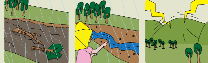
急に川の流れが濁り、流木が混ざっている 雨が降り続けているのに、川の水位が下がる 山鳴りがする