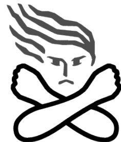
女性に対する暴力根絶のためのシンボルマーク