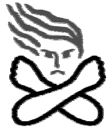
女性に対する暴力根絶のためのシンボルマーク

暴力は、その対象の性別や加害者、被害者の間柄を問わず、決して許されるものではありませんが、特に、夫、パートナーからの暴力、性犯罪、売買春、セクシュアル・ハラスメント、ストーカー行為等女性に対する暴力は、女性の人権を著しく侵害するものです。しかし、問題として取り上げることへの抵抗感などから潜在化する傾向があります。男女共同参画社会を形成していく上で克服すべき重要な課題です。