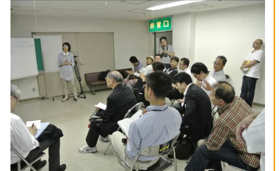
【グループ1の討議風景】