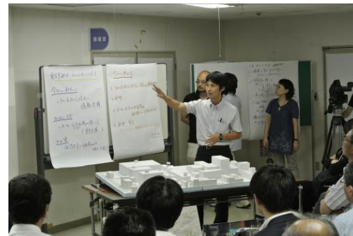
【遠藤先生より広場について説明】