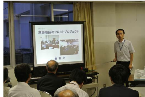
【平松室長より全体計画の概要について説明】

最後に本日のグループ討議で出された意見について各グループの代表が発表を行い、参加者全員で共有しました。