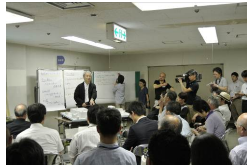
【伊東代表より市民ホールについて説明】