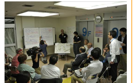
【グループ2の討議風景】