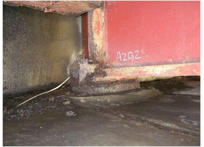
支承【腐食、土砂詰まり】