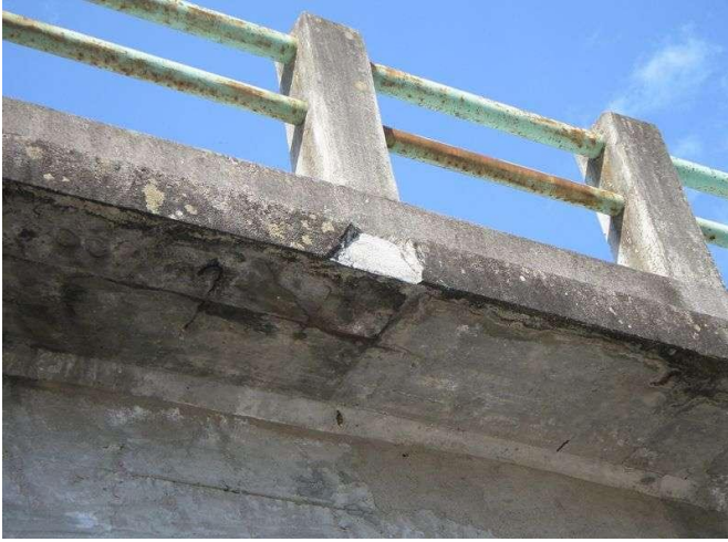
コンクリート橋【剥離・鉄筋露出】