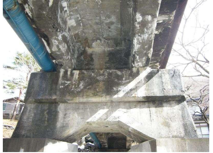
コンクリート橋【漏水・遊離石灰】