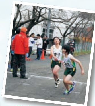
11月19日 第56回釜石市民駅伝競走大会