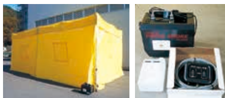
【整備品】煙体験ハウス一式（煙体験テント1基、 発煙機1台、鋳物重り6個）

体験利用については、釜石市婦人消防連絡協議会（事務局 釜石消防署 ☎22-2526）にお問い合わせください。