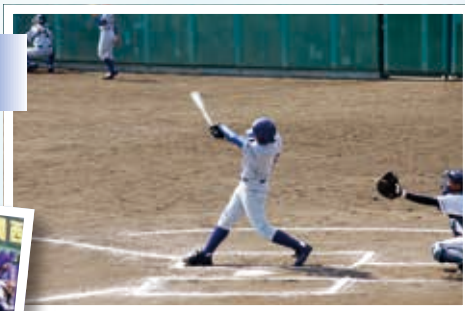
3月26日 第7回全日本少年春季軟式野球大会に 釜石東中学校が初出場