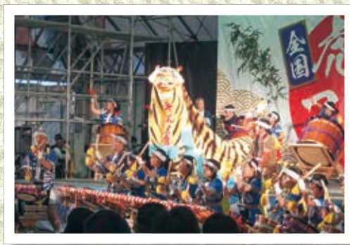
太鼓の音とともに勇壮に舞う虎舞 (平磯芸能保存会)

参加した12団体：かまいしこども園、只越虎舞、甲州台ヶ原宿虎頭の舞(山梨県北杜市)、尾崎青友会、箱崎虎舞保存会、鶴住居青年会、陸中弁天虎舞(大槌町)、白浜虎舞好友会、左比代虎舞(青森県八戸市)、錦町青年会、平磯芸能保存会(宮城県気仙沼市)、平田青虎会