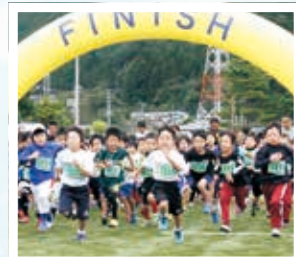
10月10日 第42回釜石健康マラソン大会