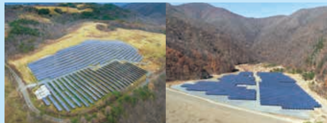
金石橋ノ木平太陽光発電所 金石中の沢メガソーラー発電所

メガソーラー発電所とは？ 発電容量が1メガワット（1,000kW）以上の大規模な太陽光発電所のこと