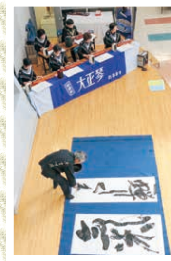
新たに釜石市芸術文化協会に加盟した「ふるさと復興支援グループ釜南44」の書道と琴城流大正琴白百合会のコラボレーション

今年は「子ども芸術文化の鑑賞～次世代を担う若い息吹に触れよう・育てよう～」をスローガンに、9月から12月まで展示部門19団体、発表部門19団体が日ごろの活動の成果を発表します。メイン会場となったシープラザ遊、シープラザ釜石では、これまでと同様、華道、絵画、写真などが展示され、舞台発表が行われた他、市内で開催されている華道や茶道の子ども教室受講生も次代の文化の担い手として参加し、釜石市民芸術文化祭に花を添えました。