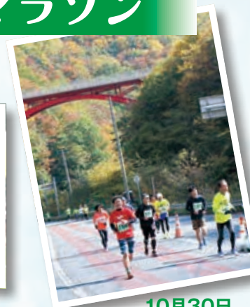
10月30日 第7回かまいし仙人峠マラソン大会