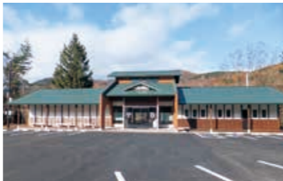
橋野鉄鉱山インフォメーションセンター

橋野鉄鉱山へ通じる県道35号釜石遠野線は、笛吹峠の遠野市側が全面通行止めとなっています。また、橋野町の一部で片側交互通行となっていますので、通行の際はご注意ください。