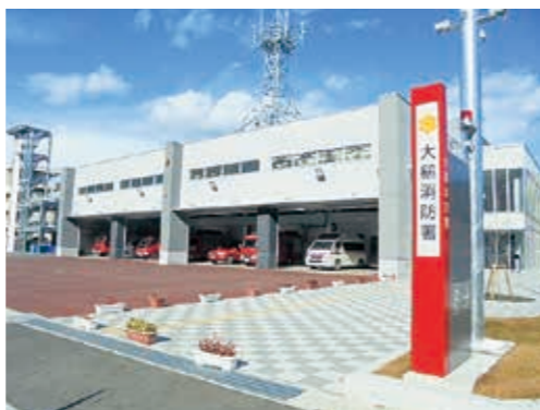
3月に完成した大槌消防署