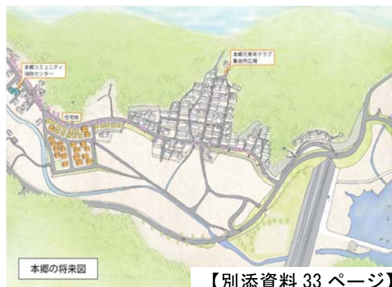
【別添資料 33 ページ】

地域からの要望施設については、市内の被災地域全体をみながら、それぞれの地域に必要なものをよく考え、できる限り応えていきたいと思っています。