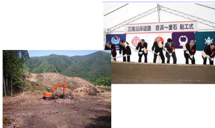
【別添資料 10, 11 ページ】