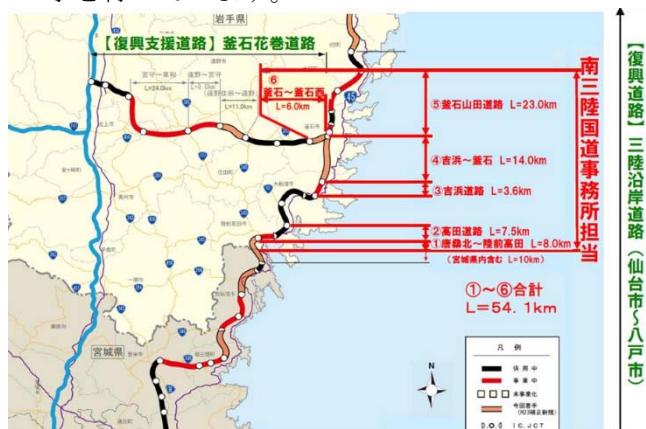
【別添資料 4 ページ】

また、三陸沿岸道路の吉浜～釜石区間は、平成23年の11月に設計をするための測量の立ち入りについて、説明会を唐丹地区と平田地区合同で行いました。今年の2月に工事起工し、現在は立ち木の伐採が終わり道路の形にする工事を行っています。