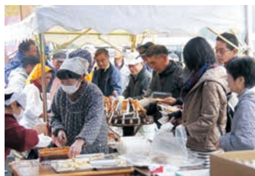
大勢の人でにぎわった昨年の水車まつり