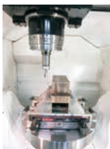
5軸マシニングセンタ

近代製鉄発祥の地として鉄のものづくりの技を受け継ぐまち、釜石には、製造機械や船に使われる金属、鉄やステンレス、アルミニウム、固くて熱に強い特殊な合金などを、さまざまな形の部品に加工する企業が集まっています。 そうした企業がつくる部品がきちんとした形状、寸法になっていることを1000分の1ミリメートルの単位まで確かめるためには、複雑な形のものでも正確に測る測定器が必要です。当センターに入居している「岩手大学ものづくりサテライト」には、「3次元測定器」という精密な測定器が設置されています。また、「5軸マシニングセンタ」という、金属の材料をより複雑な形状に精密に加工する、工作機械なども設置されています。 当センターは、同サテライトの2人の技術支援員と協力して、コンピュータによる加工データや図面の作成、工作機械や3次元測定器の操作などの高度な技術を、地域の企業が習得できるよう支援しています。自社で開発した製品やお客様からいただいた図面で部品を試作し、測定データを付けて納品、そして次の受注や販売につなげる、こうした実際のものづくりの流れに沿って、技術支援員と一緒に作業し機器の操作をお手伝いします。 新製品の開発、新分野の受注に取り組むものづくり企業を応援する、当センターと岩手大学の新たな支援体制を活用してください。