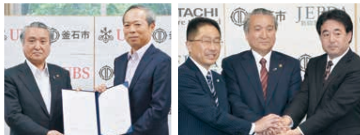
UBSグループと市との協働宣言の署名 市と株式会社日立製作所(左)とJEBDA(右)との三者協定の締結

市と株式会社日立製作所、一般社団法人新興事業創出機構(JEBDA)は、オープンシティ戦略の推進により、地域の活性化と社会イノベーションを実現することを目的に、「釜石市における地域の活性化に向けた取組に関する協定」を6月14日に締結しました。 (株)日立製作所は、JEBDAのコーディネートにより、2013年から唐丹地区のコミュニティや産業の活性化を目指して、漁業協同組合や地元水産加工会社のWebサイトのリニューアル支援などIT活用による復興支援活動を展開してきました。今後も三者の連携を密にしなが、産業振興や人材育成、高齢者の見守り支援などに取り組んでいきます。 6月24日には、市と世界有数の金融機関であるUBSグループは、「オープンシティの実現のための多様な持続可能なまちづくりの推進に向けた協働宣言」を行いました。 2019年のラグビーワールドカップ開催を一つの契機として、国際都市にふさわしい多様性への共感と寛容さを持ち合わせた地域社会、釜石に関わる人が自身の可能性を拓いて活躍できる豊かな社会の構築を目指していきます。