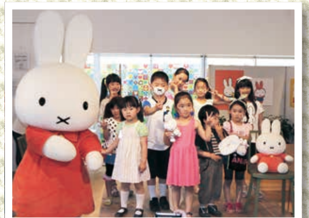
ファッションショーの最後は大好きなミッフィーと記念撮影

釜石×オランダ交流フェアとして「ミッフィーカフェがまいし」で、ミッフィーの誕生日（6月21日）をお祝いするイベントが開催されました。期間中は、フェイスペイントで頬にミッフィーの絵を描いてもらう子どもや、ミッフィーとの触れ合いを楽しみに訪れた家族連れでにぎわいました。ミッフィーの衣類やアクセサリ、バッグなどを身に着けた子どもたちによる、ファッションショーも開催され、市内外から集まった子どもたち10人が愛らしい姿を披露。また、25日には陶器の素焼きのミッフィーに、絵の具で思い思いに色付けできるワークショップも行われました。