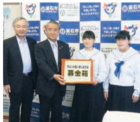
募金活動に取り組んだ釜石東中学校生徒会