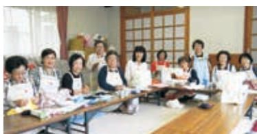
にこやかにボランティア活動をする皆さん

釜石市赤十字奉仕団は、赤十字の基本理念の基、人道的活動を行うボランティア団体で、新規団員を随時募集しています。ボランティアに興味のある人、時間に余裕のある人など、ぜひお問い合わせください。