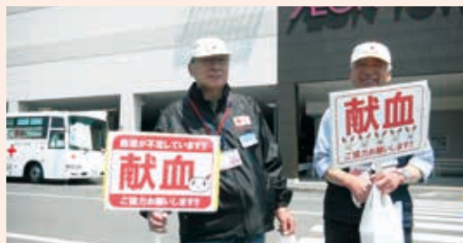
買い物客に献血を呼び掛ける奉仕団員