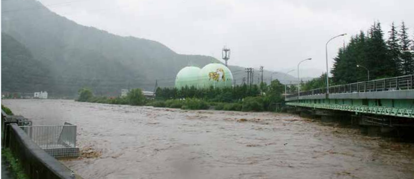
平成19年9月の台風19号による甲子川の増水（五の橋付近）