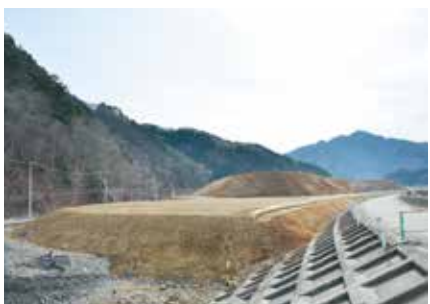
現在のスタジアム建設地（北東側から）

※メインスタンド以外には土塁を設け、勾配の上に観客席を計画します。 ※仮設観客席は、ラグビーワールドカップ2019開催時のみの設置で、大会後は撤去します。