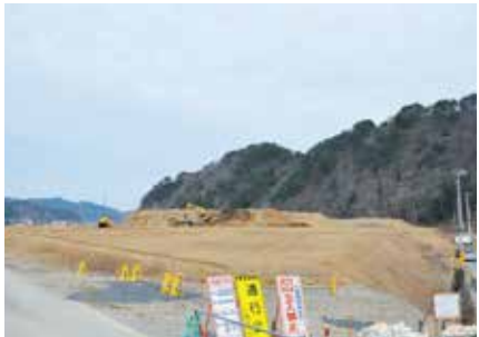
現在のスタジアム建設地（南西側から）

ラグビーワールドカップ2019の成功に向けた施設整備や気運醸成、ラグビーを生かしたまちづくりの推進に必要な資金を確保するため、市が昨年7月に設置した釜石市ラグビーこども未来基金に対し、全国の皆さんから多くの寄付金が寄せられています。