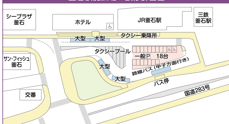
釜石駅前広場 改修計画図