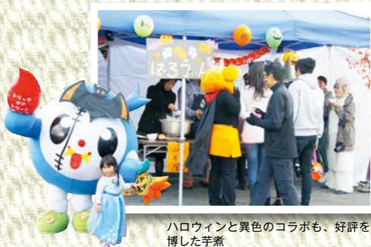
ハロウィンと異色のコラボも、好評を博した芋煮

「釜石〇〇会議」から生まれたチーム「釜石大観音仲見世リノベーションプロジェクト」によるイベント第2弾。3種類の芋煮（釜石風・山形風・仙台風）が楽しめたほか、フリードリンクバーやコスプレ衣装作成ワークショップなどさまざまな催しが行われました。仮装した人は釜石大観音の拝観料が無料になる特典も。市のキャラクター・かまリンも仮装して登場し、来場者の人気を集めました。仲見世通りは、秋の夕刻にハロウィンにちなんだ仮装した人たちでにぎわい、いつもと違う雰囲気が漂いました。