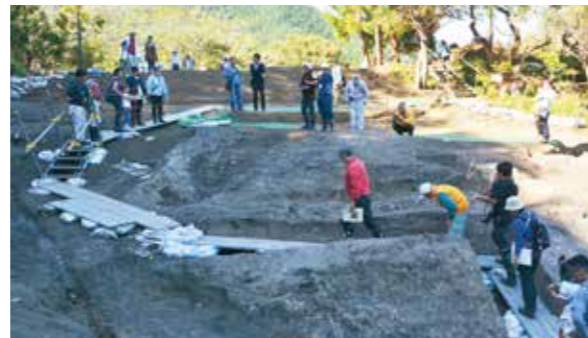
10月3日に開催した屋形遺跡発掘調査現場説明会

屋形遺跡で発見された貝塚は、現在の釜石を支える海との関わりが、縄文時代から現代に至るまで連綿と続いてきたことを示す極めて重要な遺跡であることから、現在、今後の道路建設や遺跡の保存について協議を進めているところです。