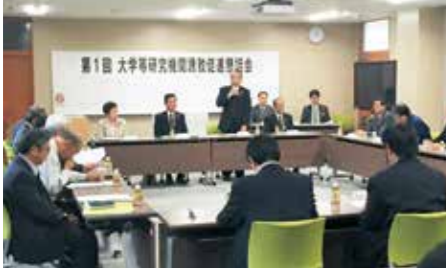
岩手大学三陸復興推進機構釜石サテライトで開催された懇話会