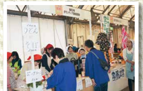
笑顔で接客する釜石市ボランティア連絡協議会のメンバー

昨年震災から復活したイベントが、今年は場所をシープラザ遊に戻して開催されました。市内外の福祉関係団体など15団体が集まり、自家製パン・マフィン・野菜・手芸品などの販売ブース、缶バッジづくり・さき織りなどの体験ブース、日々の活動の展示ブースなど、多くのブースが並びました。継続的な支援活動が続いている荒川区社会福祉協議会の『駄菓子屋あらかわ』では、くじ引きやおもちゃのコーナーで子どもたちが大いに楽しみました。また、ステージではダンス、郷土芸能、バンド演奏などが会場を大いに盛り上げました。