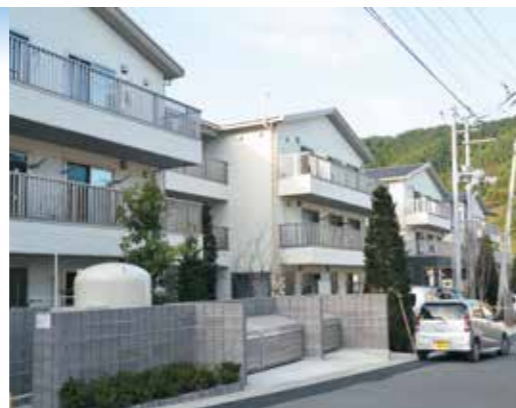
9月に完成した小白浜復興住宅1号

東日本大震災により被災した市内9漁港の物揚場や防波堤、護岸などを整備しました。[桑ノ浜、仮宿、平田、白浜（釜石）、佐須、大石、室浜、片岸、嬉石]