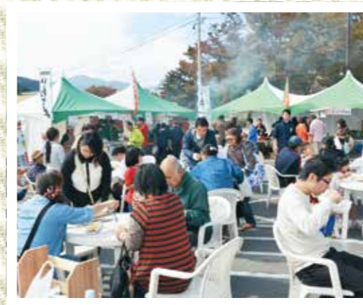
秋の味覚を堪能する来場者たち