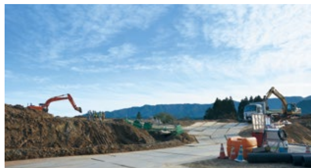
造成工事が進む高台移転地

市は、被災者の皆さんが早期に住宅再建を行えるよう、復旧・復興に向けた事業を進めています。毎月1日号では、被災21地区の未来の姿や工事スケジュールなどを地区ごとに順次お知らせしていきます。 なお、掲載する内容は、現時点での予定ですので今後変更になる場合があります。