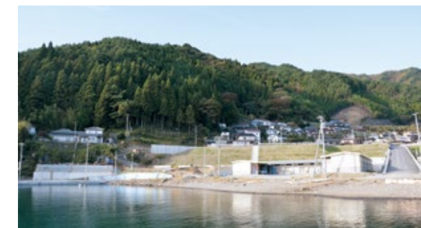
整備が進む移転跡地