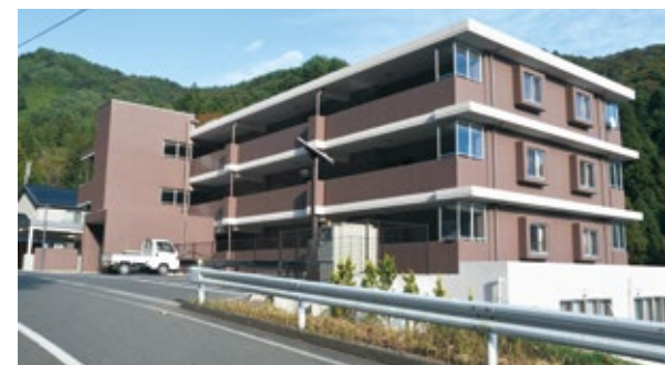
平成25年12月に完成した花露辺復興住宅