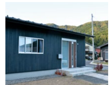
3月に完成した唐丹片岸復興住宅

用語解説 TP…東京湾平均海面の高さ。陸地の標高基準となる海面で、これを0mとして陸地の高さをはかる。 TP+6mは、東京湾平均海面から6mの高さを示す。 GH…現況の地盤の高さ。GH=3.5mは、地盤高3.5mを示す。 L…延長(長さ)を示す。 H…高さを示す。