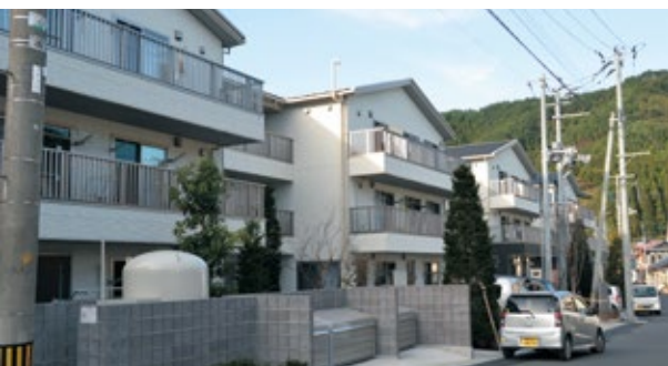
9月に完成した小白浜復興住宅1号