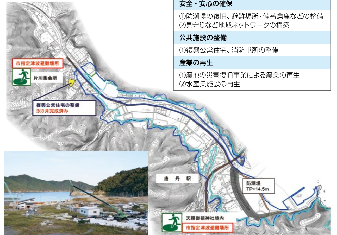
現在の唐丹片岸地区海岸部