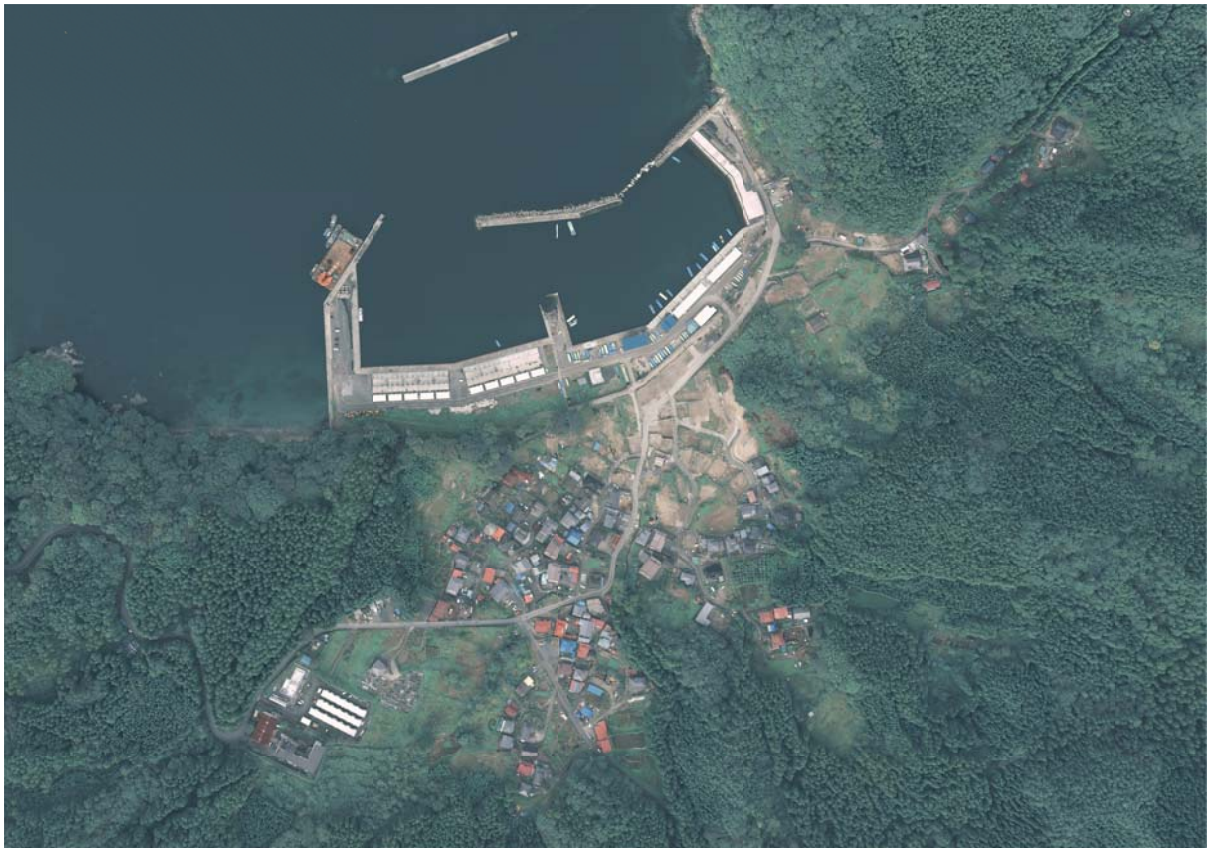
震災後(平成24年撮影)