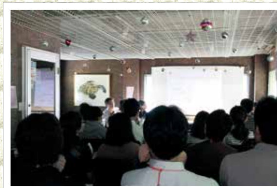
アンケートの調査結果をもとに意見交換する参加者

※UBSはチューリッヒを本拠に、世界50カ国以上に営業拠点を有する金融機関。平成24年から釜石市を中心に復興のまちづくりに従事し、これまでのべ750人が17,600時間のボランティア活動を行ってきました。平成26年6月には、釜石市、UBS、RCF復興支援チームによる「復興のまちづくりに向けた共同宣言」を発表し、行政・企業・非営利組織の連携・協働を進めています。