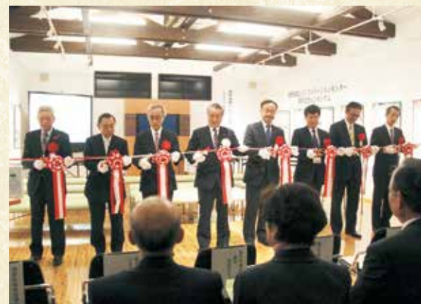
橋野鉄鉱山インフォメーションセンター開所式（平成25年11月10日）