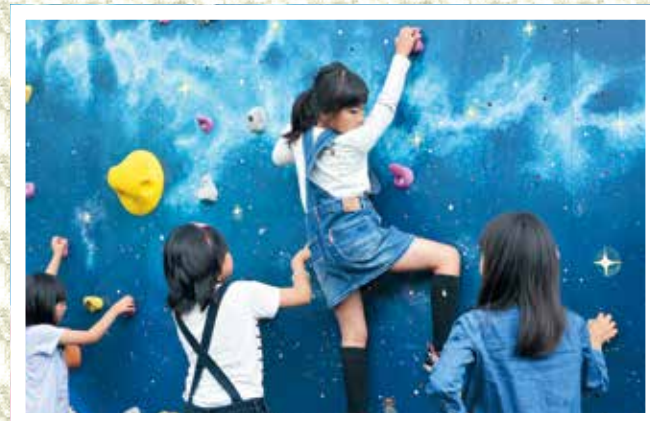
新しいクライミングウォールに挑戦する子どもたち