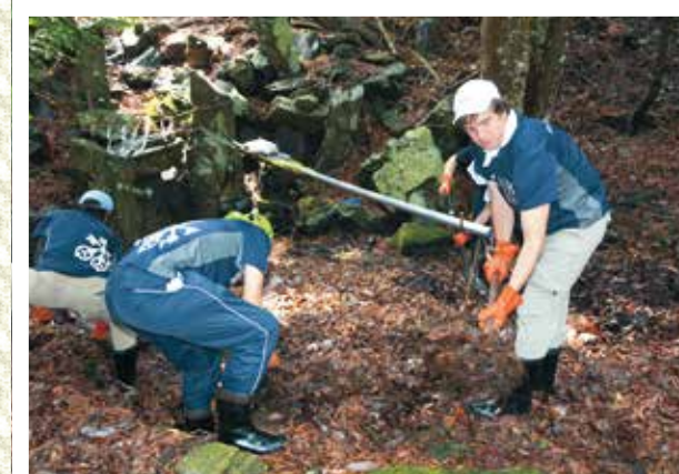
奥宮の池と参道の溝も清掃し、せせらぎも聞こえるように

現在、市内には313カ所の遺跡が確認されていますが、復興工事に伴って、やむなく壊されてしまう遺跡に対して、市では発掘調査を行い、記録保存を行っています。平成26年度までには8遺跡で調査が実施され、現在も唐丹町の大石で調査を行っています。担当した市の文化財調査員が、釜石には県内でも貴重な、沿岸部で平泉文化の影響を受けた川原遺跡があることなど、写真と実物を見せながら丁寧に解説しました。