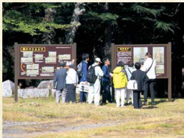
イコモスによる現地調査（平成26年9月27日）

今回世界遺産登録となったことで、釜石は日本における「鉄の古里」だということを世界に発信し、橋野鉄鉱山は釜石の大きな宝物となりました。 次代を担う子供たちが鉄を中心とした学習ができる「学習の場」としての体制をぜひつくりたいと思います。あらためて先人の偉業に思いを致すとき、遺跡の保護に努めると同時に次代に伝えていくことが、先人の偉業に報いるものになると考えます。