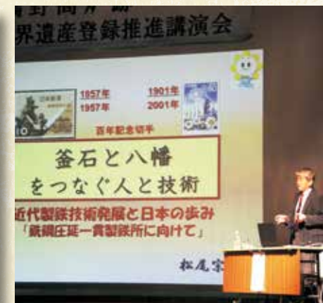
ユネスコ世界遺産登録に向けた講演会（平成22年10月5日）