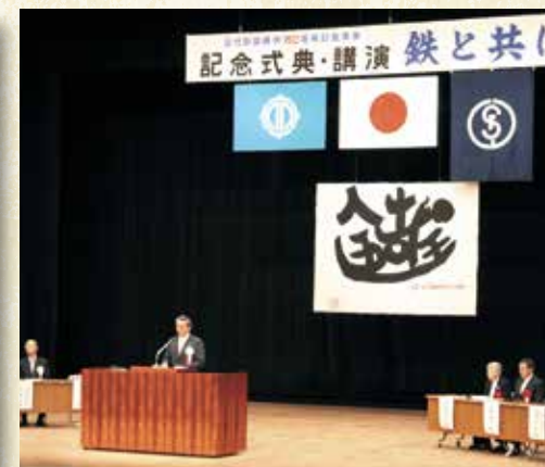
近代製鉄発祥150周年記念式典（平成19年12月1日）