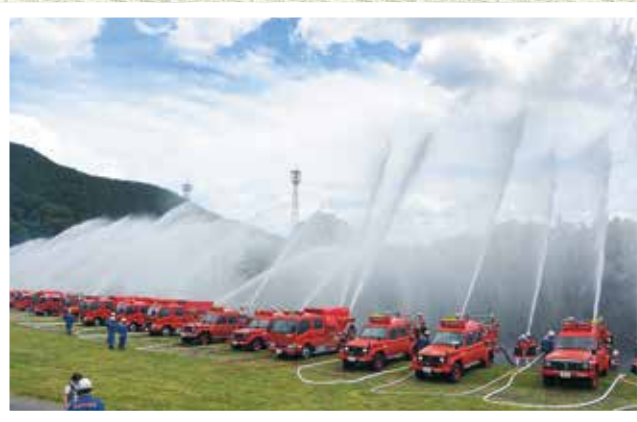
各部による放水訓練。威勢よく放水が行われました

引き続き、多くの市民が見守る中、団員と消防ポンプ自動車など車両40台による分列行進、放水訓練が実施されました。