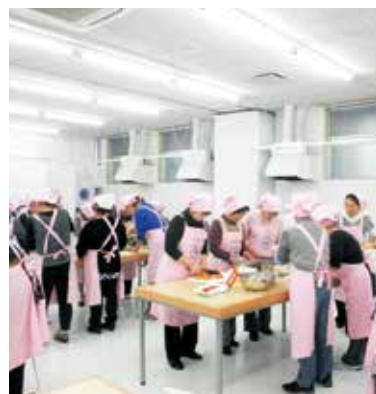
月1回実施している料理研究会

市で実施している健康教室でのサポートや市内の学校・地域で料理講師としても活動しています。また、勉強の場として月に1回料理研究会を行い、健康を考えた調理実習を行っています。会員の中には、料理教室を開き、地域の中で自主的に活躍している人もいます。