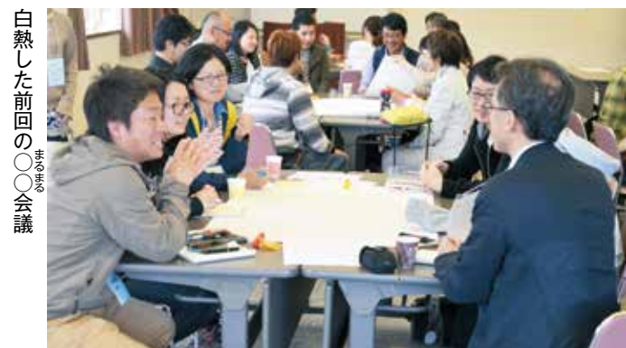
白熱した前回の〇〇会議

例えば「国際化」チームは、4年後、すぐに「やってくるラグビーワールドカップで、外国人観光客をもてなすために、英語に触れる機会を増やすことを目的に英語を話そうの会「チャットラウンジ」を週2回開いています。 「ラグビーを活用する」チームは、ラグビーをまちの本当の資産にすることを目指しています。シューエイプスのホーム観客動員数アップのためのスタンプリーパー企画を検討しています。 このほかのチームも、「一緒に取り組む人を増やしたいので、興味のある人はぜひ見に来てほしい」と話しています。