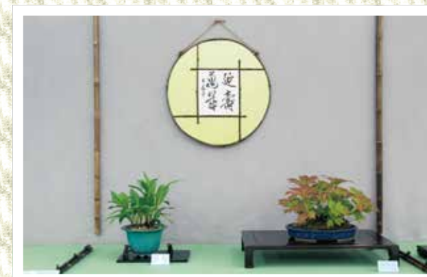
山野草と書道作品を合わせ、風情が感じられる展示もありました

来場者は一つ一つの作品を熱心に鑑賞したり、同蘭煎会が心を込めて入れた煎茶をゆっくりと味わい癒されながら作品展を楽しんでいました。