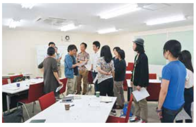
自分の置かれた状況で価値感（アイデンティティ）が変わることを確認する参加者たち