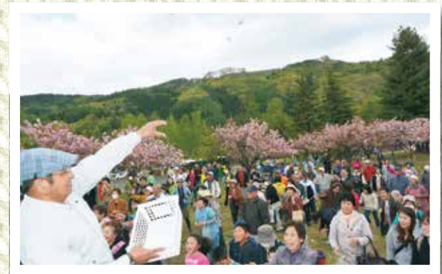
恒例のもちまきでにぎわう青ノ木グリーンパーク

イコモスの世界遺産登録勧告を受けて、この日も多くの人押し寄せ中、「橋野高炉跡八重桜まつり」が開催されました。来場者は散らずに美しさみせた八重桜を愛でながら、橋野高炉跡の見学会やもちまき、豚汁の振る舞い、バードウォッチングなど、橋野の春を楽しみました。また、この日、市が釜石観光物産協会に委託している直通シャトルバス（釜石駅～橋野鉄鉱山）の試験運行もあり、案内を担当する釜石観光ボランティアガイド会の会員や市の関係者らが、所要時間や案内のポイントなどの確認を行いました。