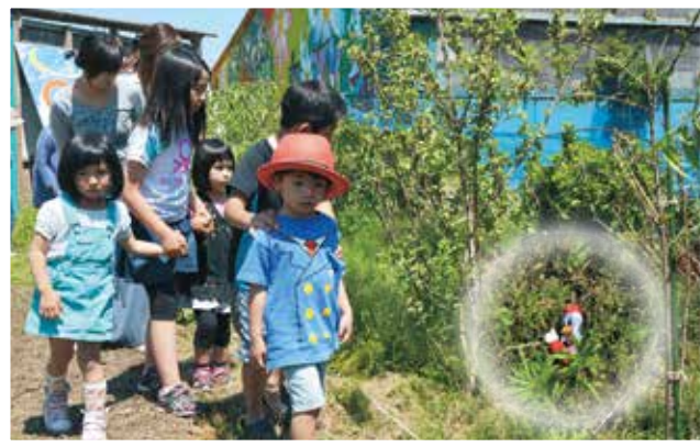
自然にまぎれている人工物を夢中に探す子どもたち

希望と笑顔のこすもす公園は、子どもたちが屋外で元気に遊ぶイベントを今年も開催しました。開催にあたっては、「子どもたちが夢を抱ける地域づくり」を今年の地区テーマに掲げる釜石ロータリークラブが協力しました。イベントには、震災ボランティアからつながりのある東京の人たちも駆けつけ、宝箱探しなどのゲームを行ったほか、さんりくクリアス・シェアリングネイチャーの会の企画で、自然の中で人工物を見つけるネイチャーゲームなどを行いました。公園には遊びまわる子どもたちの歓声が響きました。