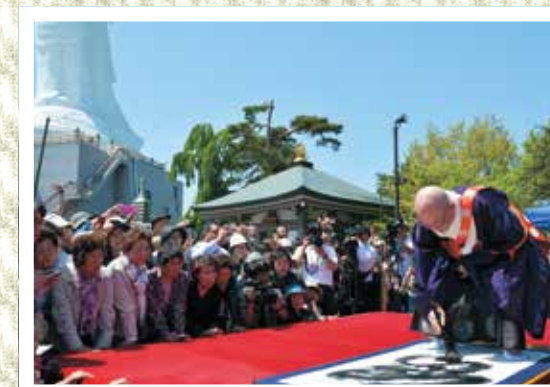
森貫主の力強い筆さばき