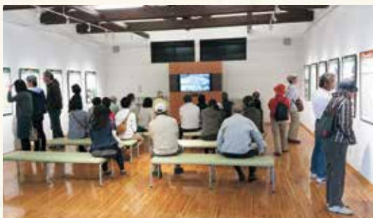
多くの人を訪れた橋野高炉跡(三番高炉)(上)と橋野鉄鉱山インフォメーションセンター(下)

広報かまいし5月15日号でお知らせしたとおり、去る5月4日、ユネスコ(国連教育科学文化機関)の諮問機関であるイコモス(国際記念物遺跡会議)は、当市の橋野鉄鉱山(橋野高炉跡及び関連遺跡)を構成資産に含む「明治日本の産業革命遺産」について、世界遺産一覧表への「記載」が適当と勧告しました。 このことを受け、橋野鉄鉱山の見学者が大幅に増加しており、橋野鉄鉱山インフォメーションセンターの5月の来場者数は6300人を超え、昨年と比べて約4.8倍となっております。