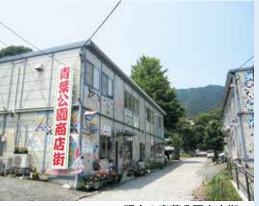
現在の青葉公園商店街

再建を希望する被災事業者には、復旧のための補助制度や税制の優遇制度、融資制度などさまざまな制度があります。