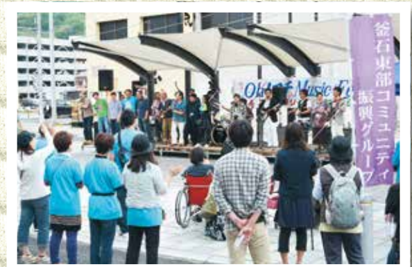
名残惜しい最後はみんなで大熱唱