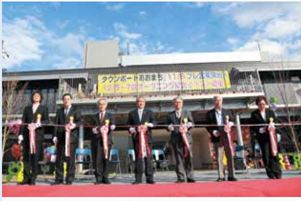
昨年開業したタウンポート大町

中心市街地東部地区では、大型商業施設や市営大町駐車場に続き、昨年12月には、共同店舗「タウンポート大町」が開業しました。 この施設は、飲食店や美容院、小売店など個性豊かな9店舗（被災事業者は8店舗）が集まり、グループ