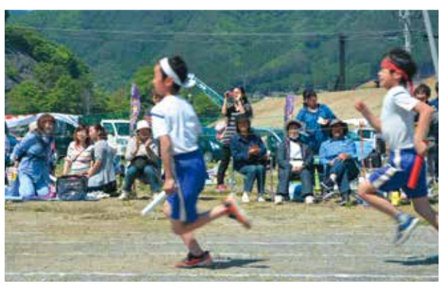
「抜かれるな〜」「追い越せ〜」応援も暑さに負けずヒートアップ

雨で順延となったこの日、5回目となる唐丹小学校と唐丹中学校の合同運動会が開催されました。この運動会は、唐丹児童館の園児や地域の皆さんも参加する地域の大運動会。徒競走やリレー、綱引き、玉入れなど、出場した選手たちは額に汗しながら、一生懸命に頑張りました。また、応援合戦やよさこいソーランなど、地域が一つになりながら、大いに盛り上がりました。市内では、このほか4中学校（釜石東中学校のみ16日）、23日には8小学校で運動会が行われました。