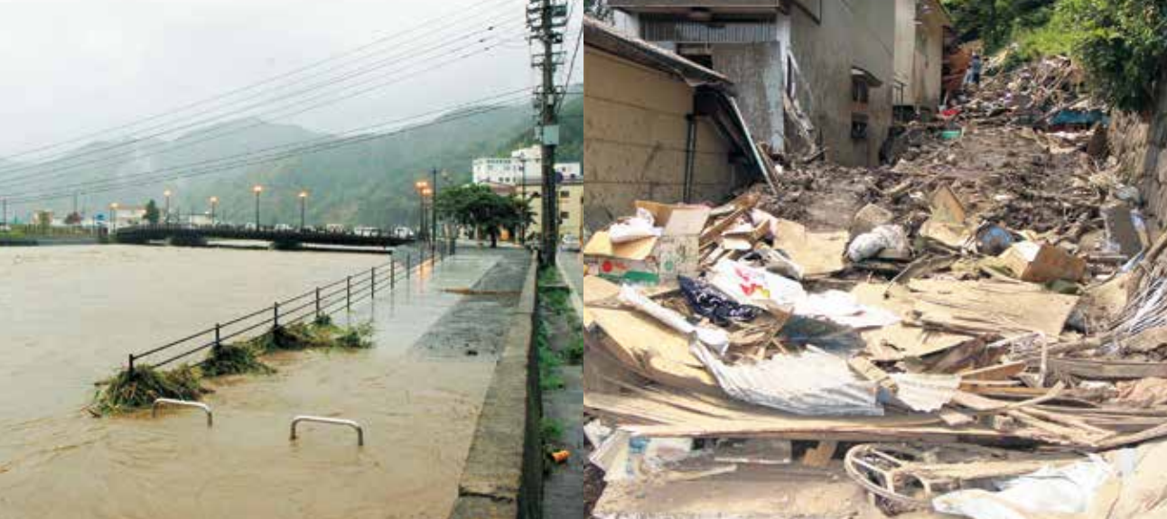
平成19年増水する甲子川