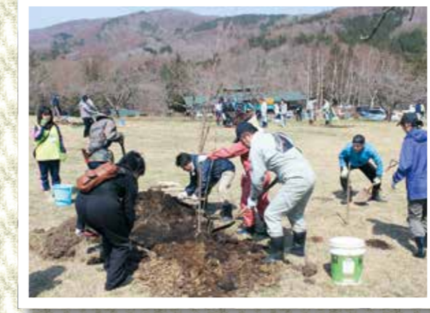
植樹作業に精を出す参加者たち