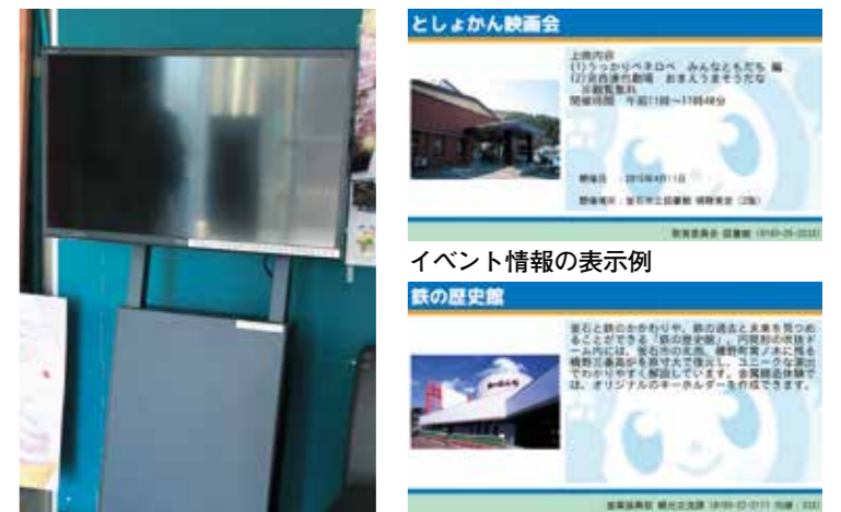
デジタル情報掲示板 観光スポット情報の表示例

◆設置場所 市民課、保健福祉センター、教育センター、各地区生活応援センター、図書館、釜石物産センター、鉄の歴史館、橋野鉄鉱山インフォメーションセンター ※閲覧できる時間は、各施設の業務時間内です。