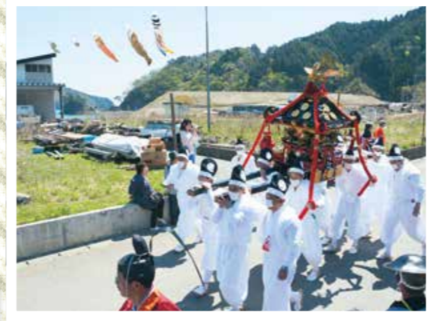
御神輿と鯉のぼりの共演も