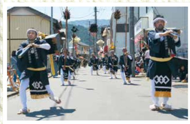
「いよお〜。いよお〜。あれはどこへとなあ〜」（御道具組の口上）