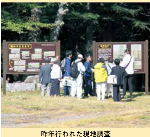
昨年行われた現地調査

世界遺産条約に定められる世界遺産委員会の諮問機関として、各提携国から推薦された文化遺産候補の価値評価や保全管理状況などに関し、世界遺産委員会に対して勧告を行っている。