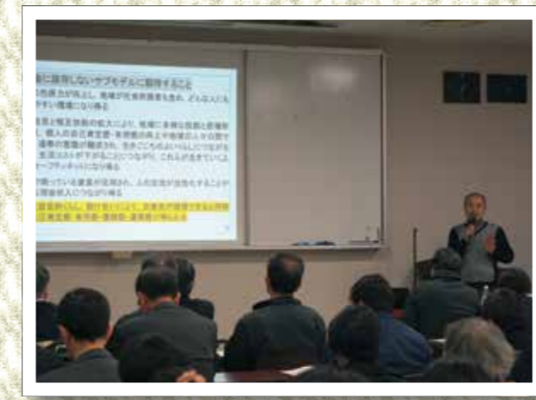
お金に依存しないサブモデルに期待すること