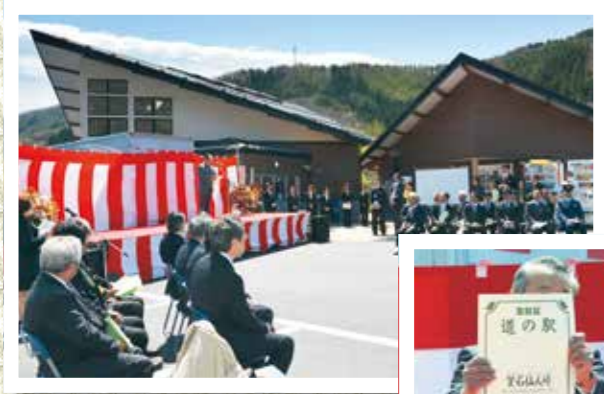
盛大に開催された開業セレモニー