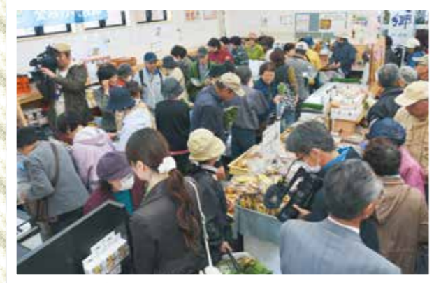
大勢の客でにぎわう多目的棟内

道の駅の開設を長年待ち望んでいた甲子地域の住民が見守る中、道の駅「釜石仙人峠」がオープンしました。開業の式典では、道の駅登録証伝達、テープカット、餅まきなどが行われました。施設内の多目的棟では、地域の特産品や農産物などが販売され、完売する商品も。飲食コーナーでは、釜石ラーメンのほか、新しく開発されたしょうゆ味のアイスクリームが提供され、ほんのり感じるしょっぱさが好評で、釜石の新しい名物になりそうです。また、道の駅は、「アユ躍る清流と甲子柿の里」という愛称も付けられ、秋の甲子柿の販売も待ち遠しく、観光の拠点として期待されます。