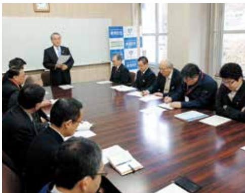
第1回釜石市 まち・ひと・しごと創生本部会議

国では、急速な少子高齢化の進展と人口減少に対応するため、昨年11月に「まち・ひと・しごと創生法」を施行し、12月には「まち・ひと・しごと創生長期ビジョン」と「まち・ひと・しごと創生総合戦略」を閣議決定しました。国の総合戦略では、①東京一極集中の是正②若い世代の就労・結婚・子育ての希望の実現③地域特性に即した地域課題の解決という活力ある日本社会を維持していくための3つの基本的な視点を示し、本格的な取り組みが始まる2015年は地方創生元年と呼ばれるれています。 当市においても、市政の最大の課題である人口減少・少子高齢化を克服し、将来にわたって活力ある持続可能なまちを目指すべく、4月1日に市長を本部長とする「釜石市まち・ひと・しごと創生本部」を設置しました。部局間の緊密な連携のもと、雇用の創出や移住・定住の推進、子育て環境の充実など、具体的な施策を盛り込んだ「釜石市版総合戦略」と、人口の現状と将来の展望を提示する「釜石市版人口ビジョン」を年度内に策定します。総合戦略の策定に向けては、人口ビジョンの目標年となる2040年を現役で迎え