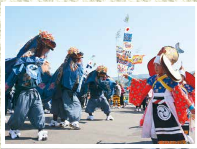
青空の下、見事に舞う（荒川熊野権現御神楽）

晴天の中、大名行列を伴った神輿渡御の行列が賑々しく唐丹を練り歩きました。正式には、唐丹町常龍山鎮座天照御祖神社の「式年大祭神輿渡御式」。3年に1度のお祭りでしたが、震災の影響で2012年の渡御は見送られました。住民の熱い想いと多くの支援により今年復活を果たしましたが、復興工事の関係で渡御の距離は小白浜漁港を御旅所として折り返す半分の距離に。行列の規模も約500人と小さくなりましたが、伊達藩に由来する、300年以上の歴史を持つ大名行列や郷土芸能の盛り上がりは復興への想いを物語っていました。